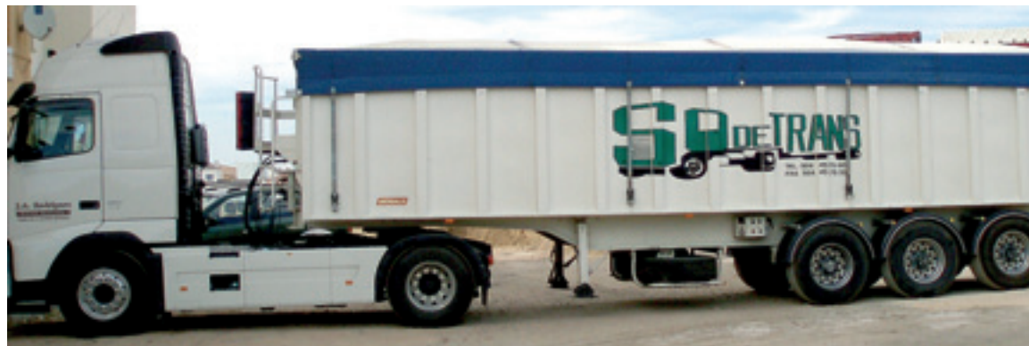
Camión perteneciente a la flota de Sodetrans .

–¿Sus clientes se circunscriben solamente a la región? –Contamos con una cartera de