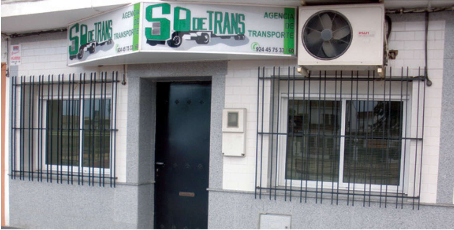
Fachada de las oficinas de la Cooperativa de Transportes Sodetrans ubicadas en Puebla de la Calzada .